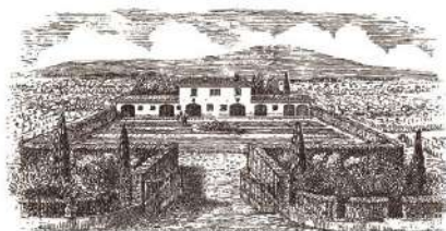
Veduta dell'azienda agricola Casale del Giglio, alle Ferriere